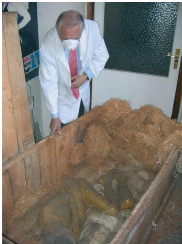
Apertura del cajón donde se encontraba la «Mujer Herpética».