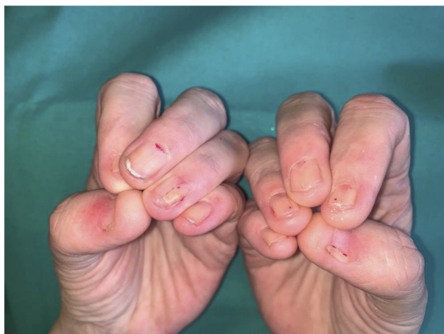
Figura 5 Enfermedad de Fong o síndrome de uña-rótula. Hipoplasia ungueal del primer, segundo, cuarto y quinto dedos de ambas manos con las características lúnulas triangulares en los terceros dedos. Además, se observa cómo la lámina ungueal del segundo, cuarto y quinto dedos de ambas manos no alcanzan el borde libre del dedo.

y pigmentación reticulada cutánea anómala 3 . Los cambios ungueales son la primera manifestación del cuadro y suelen aparecer antes del primer año de vida. Las uñas de las manos se ven más afectadas que las de los pies, presentando una clínica muy liquenoide con surcos y hendiduras longitudinales, pterigión y, en algunos casos, anoniquia 3,4 . Puede acompañarse de afectación sistémica, como trastornos pulmonares, alteraciones gastrointestinales y neoplasias, entre otras, y en el 50-90% de los casos de una insuficiencia de la médula ósea, que es la principal causa de muerte 3,4,6,8 .