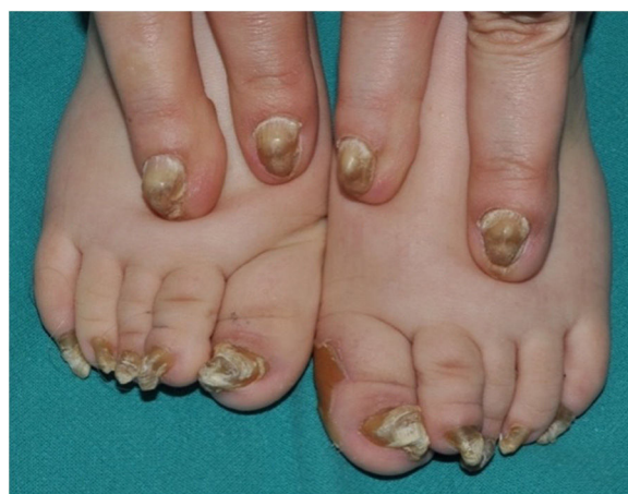
Figura 6 Paquioniquia congénita en una madre y su hijo. En las uñas de los pies se observa un gran aumento en el grosor de la lámina ungueal y el lecho ungueal que adquiere forma de gancho, junto con una coloración blanco-amarillenta. Se observa además una queratodermia plantar en el borde interno del primer dedo del pie izquierdo. En las uñas de las manos observamos también una paquioniquia, junto con una coloración amarillenta-marrónácea.

La clínica se caracteriza por la tríada de distrofia ungueal, queratodermia palmoplantar y dolor plantar 2,4 . Los cambios ungueales son la manifestación más precoz y suelen estar presentes en la mayoría de los casos antes del año de vida 4,11 . Se observa un engrosamiento de la lámina ungueal de predominio distal y una hiperqueratosis del lecho ungueal de la mayoría de las uñas, aunque en algunos pacientes se ven más afectadas las de los pies, quizás por la mayor incidencia de traumatismos 6,8,29 . La uña se va engrosando y los