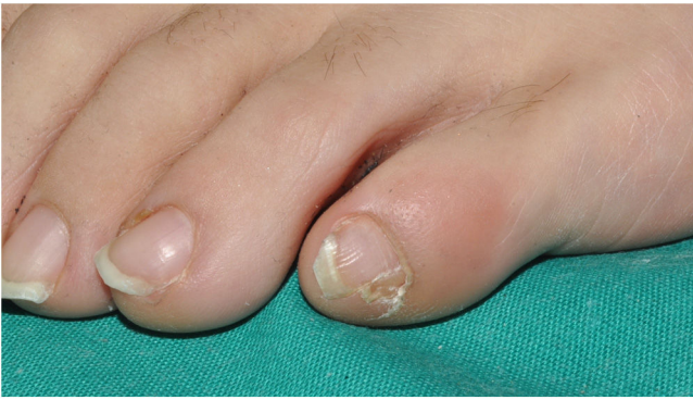
Figura 4 Doble uña congénita del quinto dedo del pie. Uña más amplia con una hendidura longitudinal que divide la uña en 2 partes, siendo la más pequeña la uña accesoria.