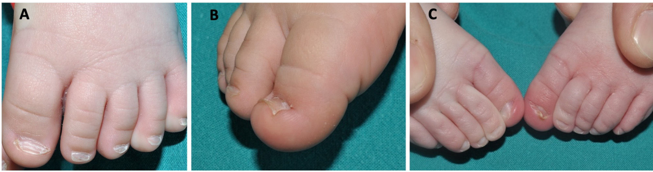
Figura 1 A) Uñas de un recién nacido con morfología triangular, líneas de Beau y coiloniquia. B) Coiloniquia con los bordes de la uña evertidos y una concavidad central. C) Hipertrofia del pliegue lateral de los primeros dedos del pie de un neonato que cubre parte de la lámina ungueal.