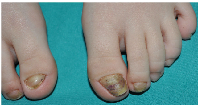
Figura 2 Mal alineamiento congénito del primer dedo del pie bilateral con mayor afectación en el lado izquierdo. Uña distrófica con crecimiento lateralizado, morfología trapezoide, líneas de Beau, onicolisis y coloración amarillenta-marrónácea.

casos más severos se recomienda un abordaje quirúrgico, siendo preferible realizarlo en los primeros años de vida 3 .