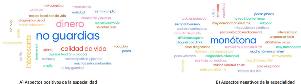
Figura 1 Percepción de los estudiantes de medicina al inicio del curso sobre A) aspectos positivos de la especialidad y B) aspectos negativos de la especialidad.