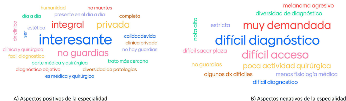
Figura 2 Percepción de los estudiantes de medicina al final del curso sobre A) aspectos positivos de la especialidad y B) aspectos negativos de la especialidad.

la Fundación Piel Sana de la Academia Española de Dermatología está ejerciendo campañas de promoción para dar a conocer la Dermatología y la actividad del dermatólogo a la población general 10 .