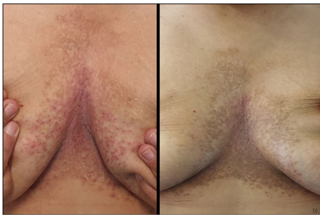
Figura 2 Enfermedad de Darier, paciente 2. A) Pretratamiento; B) Mejoría tras 12 semanas de tratamiento con isotretinoína 30 mg y gel de diclofenaco sódico al 3%/2 veces al día.

exacerbación extensa, se inició tratamiento con acitretina 25 mg, obteniendo una mejoría leve al cabo de 3 meses. La enfermedad recalcitrante nos llevó a combinar acitretina con gel de diclofenaco tópico al 3%, administrado 2 veces al día. Se produjo una mejoría sustancial en las 2 primeras semanas, obteniéndose la remisión completa a las 8 semanas (fig. 1). La paciente permaneció asintomática durante los 6 meses posteriores. Como terapia de mantenimiento, la aplicación de gel de diclofenaco sódico al 3% se redujo a una vez al día y no se produjeron recurrencias durante un periodo de seguimiento de 6 meses.