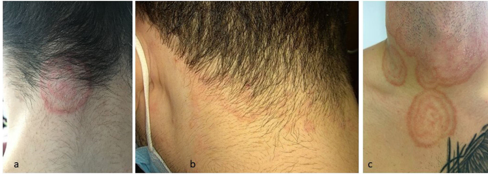
Figura 2 a,b) Formas no inflamatorias. c) Extensión a áreas distantes a la inicial.