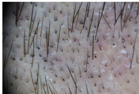
Figura 4 Imagen tricoscópica de pelos «en sacacorchos» típica de la tiña de puntos negros provocada por T. tonsurans .

En las figuras 2 y 3 pueden apreciarse diferentes imágenes de las formas inflamatorias y no inflamatorias recogidas