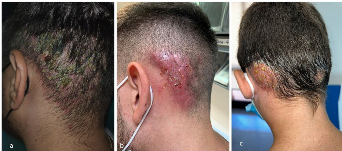
Figura 3 Formas inflamatorias.

de ellos, 106 fueron varones. La media de edad de los pacientes fue de 19 años (rango 5-40 años). La localización inicial, siendo posible más de una simultánea, fue: nuchal-occipital en 90 casos (84%), temporal-retroauricular en 17 casos (15,8%), facial en 4 (3,7%), preauricular en 2 (1,8%), espalda en 1 (1%) y no especificada en 2 (1,8%) (fig. 1a). La mayoría, 65 (60,7%), no se extendieron a otras zonas, mientras que, cuando sí lo hicieron, las áreas afectadas fueron las representadas en la figura 1b.