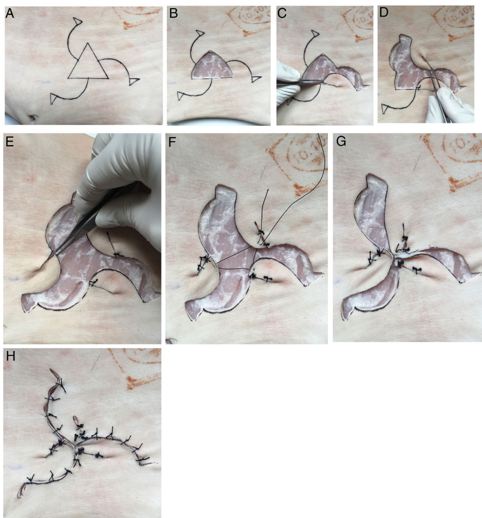
Figura 2 A-H: Descripción visual detallada de la técnica de reconstrucción sobre piel porcina.

tumoral medio fue de 2,7 (1,7-4 cm). En ningún caso observamos complicaciones inmediatas ni a largo plazo derivadas de la técnica quirúrgica. El resultado funcional y estético fue catalogado de satisfactorio en todos los casos ( ver material suplementario ).