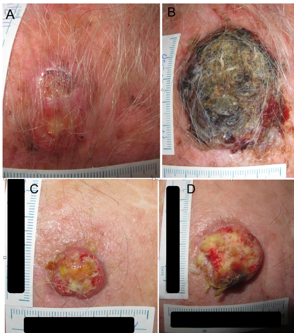
Figura 1 (1A) Carcinoma epidermoide de cuero cabelludo con un diámetro de 27 mm en el tiempo 1 (T1) y un diámetro de 53 mm a los 84 días (T2) (1B). (1C) Carcinoma epidermoide de cuero cabelludo con un diámetro de 20 mm en el tiempo 1 (T1) y un diámetro de 28 mm (1D) a los 133 días, tiempo 2 (T2).

La evidencia disponible para la tasa de crecimiento en otros tumores cutáneos es bastante más limitada. En el caso de los CEC, Cañueto et al. 23 calculó la tasa de crecimiento como el cociente entre el diámetro de la lesión en mm y el tiempo de evolución. En su estudio, realizaron particiones mediante técnicas de regresión para determinar que el punto de corte de 4mm/mes era el más adecuado para considerar a un CEC como de rápido crecimiento. Relacionándolo con una mayor propensión a las recidivas linfáticas regionales y una aparición precoz de las mismas. La subjetividad, tal como ocurre en otros tumores, supone una limitación en la determinación de la velocidad de crecimiento del CEC. No obstante, mientras en los CBCs el tumor aumenta de tamaño con el tiempo de manera estable, esto no es tan evidente en el CEC, 24 de modo que el tamaño del CEC depende más de la velocidad con la que este crece que del tiempo que la lesión permanece sin tratamiento. Por otra parte, en los tumores de crecimiento rápido el sesgo de tiempo es menor, o dicho de otra manera se