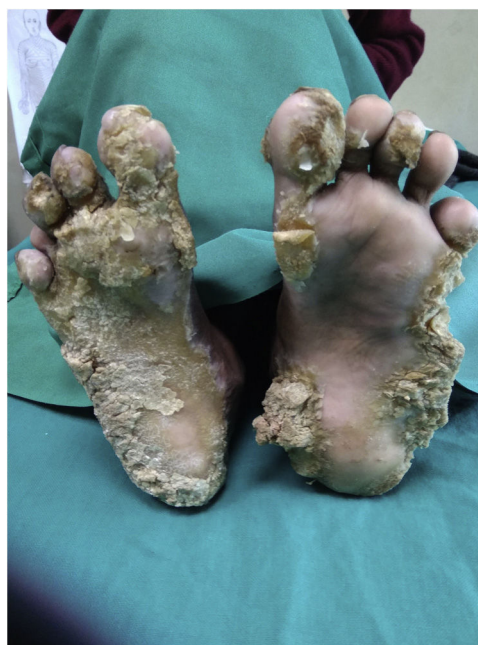
Figura 3 Mejoría parcial tras 8 semanas de acitretina.

palmoplantar es de tipo transgrediens y será gravemente incapacitante. Las pápulas queratósicas se desarrollan en áreas periorificiales y pueden extenderse a sitios de flexuras. Se producirán fisuras en los dedos de los pies, que conducirán a la autoamputación de los mismos, y el engrosamiento cutáneo puede provocar deformidades en flexión 4 . Nuestra paciente presentaba una queratodermia mutilante, pápulas periorificiales y deformidad en flexión. Sin embargo, no hubo formación de «pseudoainhum». Además, la paciente presentaba pápulas foliculares queratósicas distribuidas por ambas piernas.