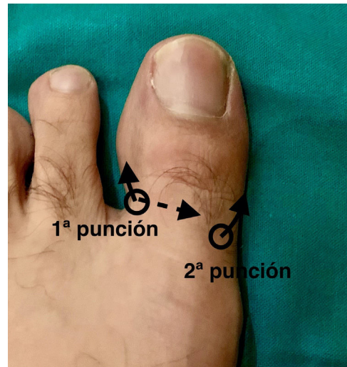
Figura 1 Ejecución técnica H. Primera punción en a nivel dorsal en canal peroneal dirigiendo por debajo el extensor largo del primer dedo y posteriormente hacia plantar. La segunda punción se realiza en el dorso del dedo en canal tibial dirigiendo la aguja hacia plantar.

Realizamos un pequeño pellizco con nuestros dedos en el dorso del dedo por encima de la falange proximal, se realiza una infiltración subcutánea por encima del tendón extensor