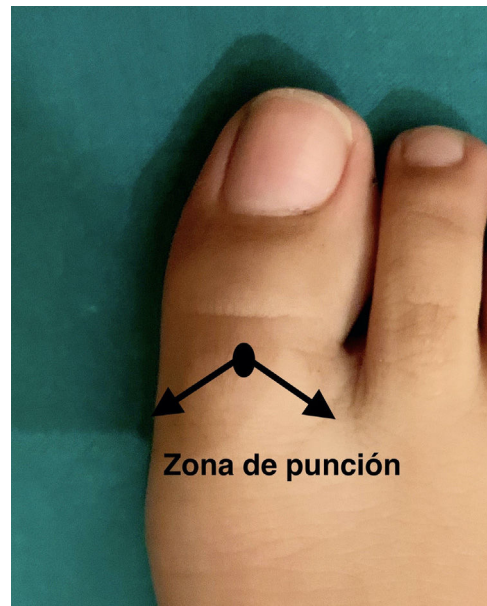
Figura 2 Ejecución técnica V. Se realiza una única punción y se dirige la aguja a la zona plantar por delante de la articulación metatarsofalángica en ambos laterales del dedo.

largo del primer dedo. Se punciona verticalmente, se aspira y se inyecta 1 ml de anestésico.