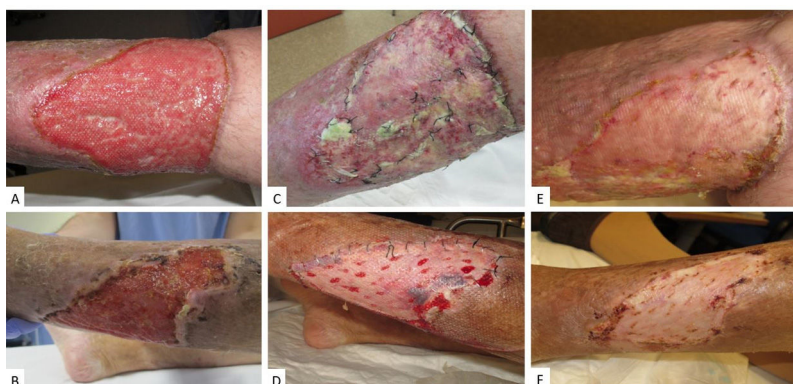
Figura 1 A) Defecto inicial en el paciente 2, tras mejorar el lecho con terapia de presión negativa previa a la cirugía. B) Defecto inicial en el paciente 3. C y D) Aspecto en el día 5 tras la intervención. E y F) Aspecto en el día 30 tras la intervención.

ACO: anticoagulantes orales; DL: dislipidemia; DM: diabetes mellitus ; EAP: enfermedad arterial periférica; ERC: enfermedad renal crónica; H: hombre; HTA: hipertensión arterial; IVC: insuficiencia venosa crónica; M: mujer.