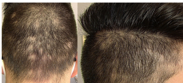
Figura 1 Presentación clínica del caso. Panel izquierdo: región occipital. Panel derecho: Región parietotemporal derecha.

la alopecia areata, la tricotilomanía o el efluvio telógeno. Se considera una alopecia sifilítica esencial cuando no hay evidencia de otra afectación mucocutánea (como en el presente caso), lo que dificulta el diagnóstico.