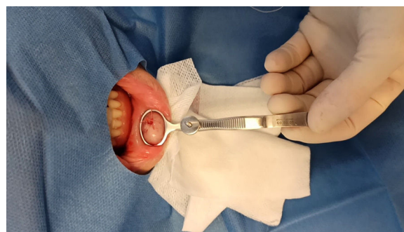
Figura 3 Biopsia de la mucosa labial en un paciente con sospecha de queilitis granulomatosa.

a tratar. Dispone de 2 palas, una de ellas actúa como base formada por una lámina metálica sólida y la otra es fenestrada, por lo que permite actuar con libertad de movimiento durante la extracción de la pieza y la sutura del defecto. Ambas están unidas por un mango metálico y su coaptación se puede ajustar, de manera que posibilita la correcta sujeción de la zona a tratar.