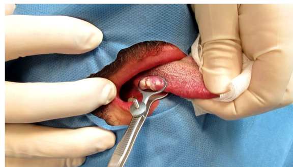
Figura 2 Biopsia de úlcera en la lengua.