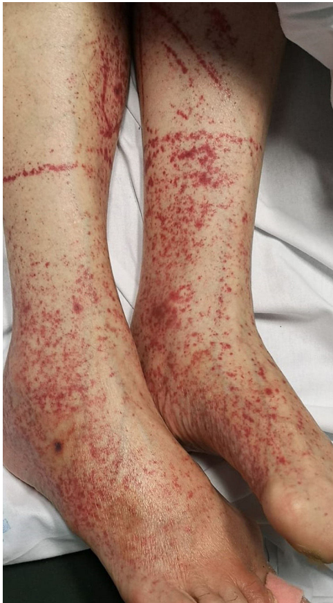
Figura 4 Petequias (crédito de la imagen: Dra. Ana Rodríguez Villa).

glúteos, fosa poplítea, muslo anterior proximal y abdomen inferior. Las erupciones petequiales son sugerentes de COVID-19 leve 6,34,41 .