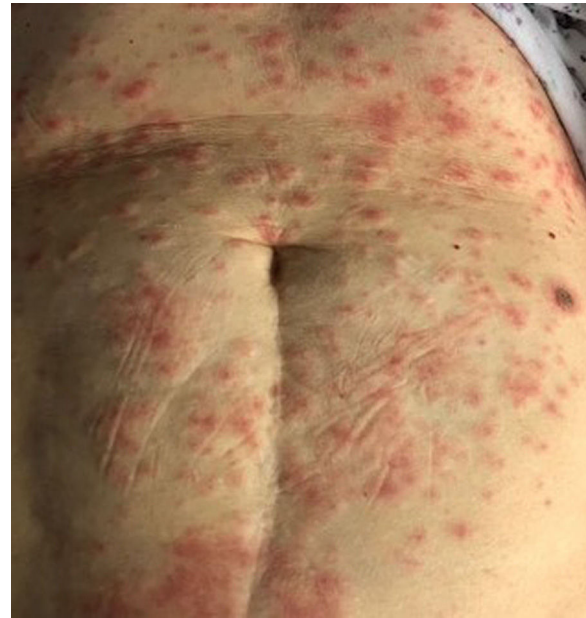
Figura 5 Erupción similar al eritema multiforme (crédito de la imagen: Dra. Zuriñe Martínez de Lagrán Álvarez de Arcaya).

En abril de 2020 se estableció un registro internacional por parte de ILDS (International League of Dermatological