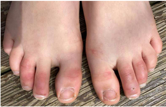
Figura 1 Dedos de Covid en un niño.

a La prevalencia ha sido inferida principalmente de las revisiones sistemáticas recientemente realizadas por Lee et al. 8 , Perna et al. 18 y Zhao et al. 23 .