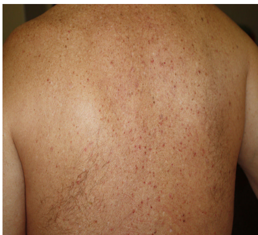
Figura 2 Erupción vesicular.

normalmente leves con aparición de prurito 3 días después del inicio de los síntomas sistémicos, y desaparición al octavo día 13 . En un estudio prospectivo de 24 pacientes infectados de coronavirus, se observó el patrón diseminado de la erupción vesicular en 18 pacientes y patrón localizado en 6. La duración de las lesiones cutáneas osciló entre 4 y 22 días, con una duración media de 10 días. Las lesiones cutáneas surgieron antes de la aparición de los síntomas de COVID-19 en 2 pacientes, con síntomas de COVID-19 en 3 pacientes y tras los síntomas de COVID-19 en 19 pacientes 35 . Los datos histológicos de 3 pacientes con erupción vesicular mostraron acantólisis sin células en balón, disqueratosis, vesículas intraepidérmicas, infiltración eosinofílica dérmica y células multinucleadas sin signos de vasculitis. Las erupciones vesiculares observadas en la COVID-19 difieren del exantema similar a la varicela, donde las características histológicas principales son atipia nuclear, grandes células multinucleadas, acantólisis en balón y vasculitis 36 . Para un reconocimiento preciso del exantema similar a la varicela asociado a la COVID-19 parece necesario descartar el virus herpes simplex-1, el virus herpes simplex-6, y el virus de Epstein-Barr, así como el virus varicela-zóster 37 .