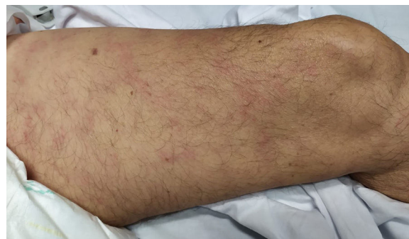
Figura 3 Livedo.

La erupción urticarial puede desarrollarse antes del inicio de los síntomas de la COVID-19, y cuando se presenta acompañada de piroxia puede servirnos de pista para el diagnóstico de la enfermedad. Aparece principalmente en el tronco, pero también de manera más generalizada 15,34 . Una paciente española de 61 años con temperatura de 37,3 °C y queja de erupción cutánea progresiva sin otros síntomas de COVID-19 fue positiva a la infección. Esto representa un caso de paciente infectado de COVID-19 sin síntomas típicos, que desarrolló compromiso cutáneo en forma de erupción urticarial. El aspecto clave de este caso es el reconocimiento de los pacientes asintomáticos para prevenir la transmisión del virus 38 . Un caso similar fue reportado por Henry et al. 7 . Se ha reportado la histopatología de estas lesiones que refleja infiltrado linfocítico perivascular, eosinófilos y edema dérmico superior 39 .