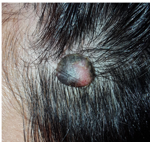
Figura 1 Aspecto clínico de la lesión localizada en la zona frontoparietal del cuero cabelludo.