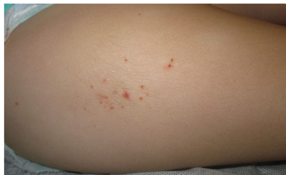
Figura 1 Lesiones en muslo derecho en uno de los casos, en forma de pápulas eritematosas excoriadas agrupadas sobre una lesión nodular de superficie hipertrichósica.

antígeno. Tras la administración de dichas vacunas pueden aparecer lesiones cutáneas, más frecuentemente en forma de prurito o nódulos subcutáneos, siendo menos frecuente la aparición de áreas de hipertrichosis o eccema. La persistencia de estas reacciones se ha descrito en el 0,5-6% de los casos y se atribuye principalmente a una reacción de hipersensibilidad tipo IV al hidróxido de aluminio. En el 77% al 95% de los niños con reacciones persistentes a las vacunas, las pruebas epicutáneas al hidróxido de aluminio al 2% son positivas, demostrando la presencia de una alergia de contacto a dicho metal 5 .