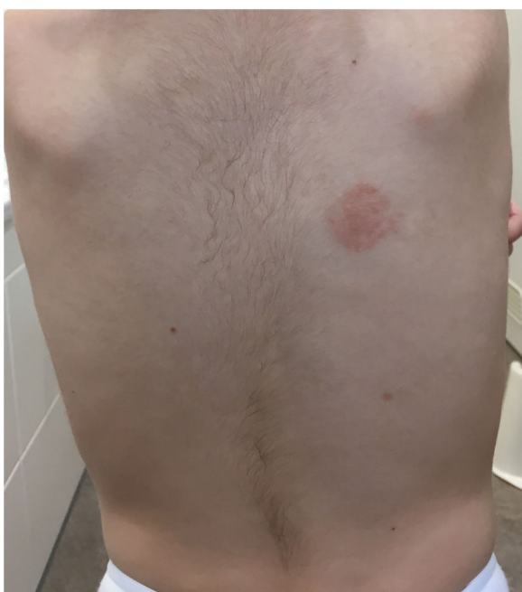
Figura 3 Lectura de las pruebas epicutáneas en uno de los pacientes a las 168 horas, observándose positividad al hidróxido de aluminio al 2% (++).

Las lesiones aparecen habitualmente entre los 12 y los 18 meses de vida, más frecuentemente tras múltiples vacunaciones (más habitualmente tras la tercera) y en vacunas de administración subcutánea. Esto último se postula que es debido a que a dicho nivel el aluminio entraría en contacto con las células dendríticas que desencadenan la reacción de hipersensibilidad. Lo más frecuente es que aparezcan a los 2 meses y medio tras la vacunación (aunque varía ampliamente en la literatura desde su aparición a las 2 semanas hasta los 13 meses). La duración de la clínica también varía ampliamente desde meses hasta incluso 10 años 5 .