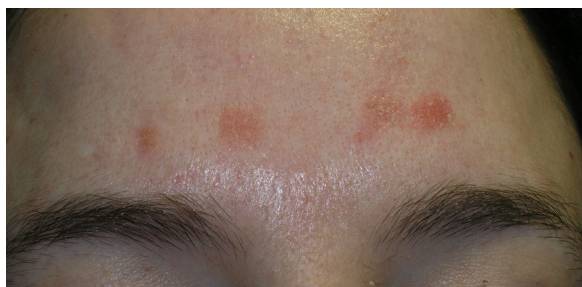
Figura 1 Pápulas anaranjadas y descamativas situadas en la frente.