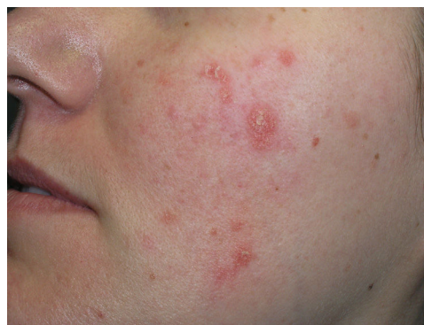
Figura 2 Pápulas descamativas de aspecto seborreico situadas en las mejillas.