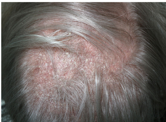
Figura 1 Placa de alopecia con descamación difusa y eritema de base.

Presentamos el caso de una mujer de 73 años con historia de placas de alopecia de un año de evolución. Se trata de placas de alopecia de bordes mal delimitados con intensa descamación gruesa. En el estudio con dermatoscopia de luz polarizada se observa la presencia de abundantes pelos en coma (flecha) y pelos en tirabuzón (*) asociados a pelos rotos (punta flecha) e intensa descamación (fig. 2).