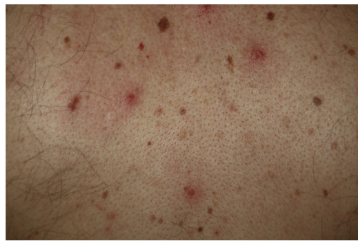
Figura 2 Papulovesículas monomorfas dispersas en el tronco.

Las lesiones vesiculares, habitualmente monofórmicas, aparecen de forma precoz y en ocasiones (15%) preceden a otros síntomas 11 , aunque en la mayoría de casos —hasta el 79,2% en una serie de 24 pacientes de Fernandez-Nieto et al.— suceden al inicio del resto de sintomatología 20 . La afectación del tronco es casi constante y en el 20% lo hacen también las extremidades (fig. 2). De forma excepcional se ha descrito la afectación facial y mucosa. Las lesiones cutáneas son escasamente sintomáticas, en forma de prurito —generalmente leve—, y en menor frecuencia de dolor o sensación de quemazón 11,19 . Aunque las lesiones pueden ser dispersas, es más frecuente el patrón extenso disseminado —el 75% en la serie de Fernandez-Nieto et al.—. En algunos pacientes pueden afectar a las extremidades inferiores, presentar un contenido hemorrágico o ser de gran tamaño y distribución difusa. La duración media