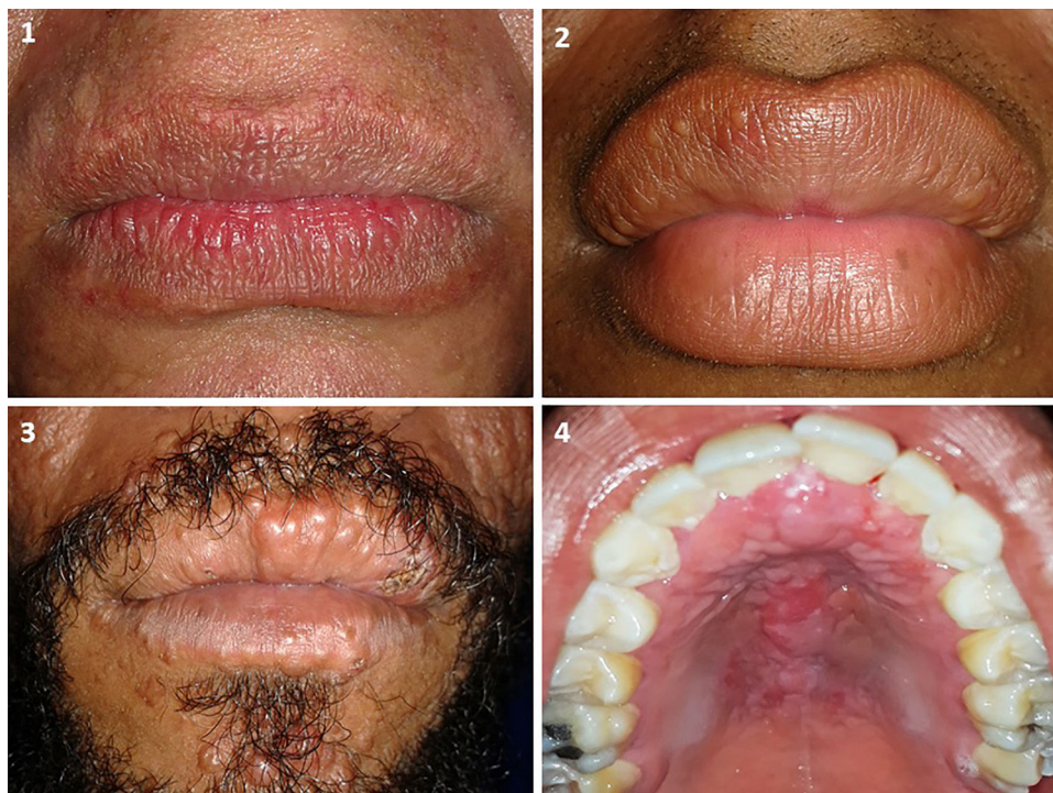
Figura 1 Lesiones asociadas a lepra. 1) Placa leprosa en los labios superior e inferior. 2) Lepromas en el labio superior. 3) Lepromas en los labios superior e inferior. 4) Leproma en el paladar.

Un total de 23 (67,6%) de los pacientes habían culminado su esquema de tratamiento multibacilar al momento de la evaluación, 10 (29,4%) fueron evaluados durante el mismo y solo 1 (2,9%) antes de iniciarlo. Aunque la mayoría de las