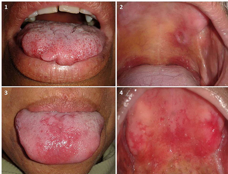
Figura 2 Lesiones no asociadas a lepra. 1) Fibroma traumático en la lengua. 2) Úlcera traumática en el paladar. 3) Candidiasis eritematosa en la lengua. 4) Estomatitis subprotésica en el paladar.