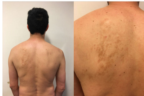
Figura 3 Se corresponde con el paciente adulto quien presenta máculas que simulan islotes hiperpigmentados agrupados localizados en región escapular izquierda.