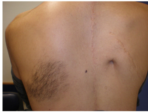
Figura 1 Mácula hiperpigmentada sobre la cual asienta vello situada a nivel escapular izquierdo. Obsérvese cicatriz quirúrgica adyacente, dado su antecedente de escoliosis severa.

Un varón de 15 años consultó por la presencia de una mácula hiperpigmentada que comprometía el área del hombro y la escápula derecha, la cual estaba presente desde el nacimiento. Sobre el nevo, se asentaba una mayor densidad de comedones cerrados y una moderada hipertrichosis con respecto al resto de la piel (fig. 2). Además, presentaba una escoliosis moderada por lo que se interpretó como un SNB.