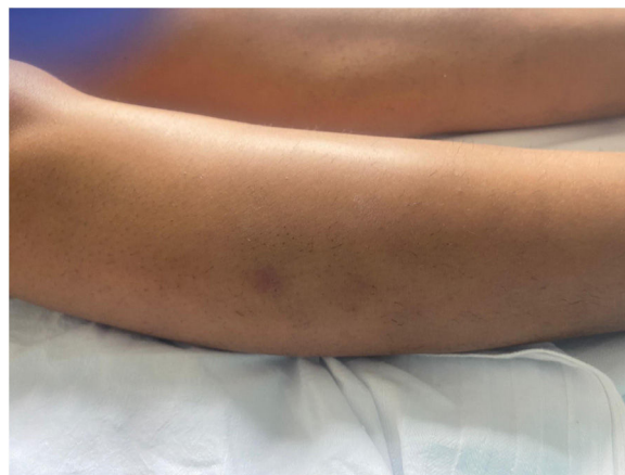
Figura 1 Lesión nodular de 2 cm de diámetro, de superficie pardusca en cara externa de la pierna derecha.

La paciente fue ingresada para observación, y se inició tratamiento con ceftriaxona, enoxaparina e hidrocortisona. Además, se pautó betametasona en crema en las lesiones cutáneas. La paciente mejoró significativamente en pocos días, permitiendo su alta hospitalaria y aislamiento domiciliario.