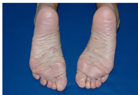
Figura 2 Pápulas y nódulos color piel normal compatibles con neurofibromas en la planta de ambos pies.