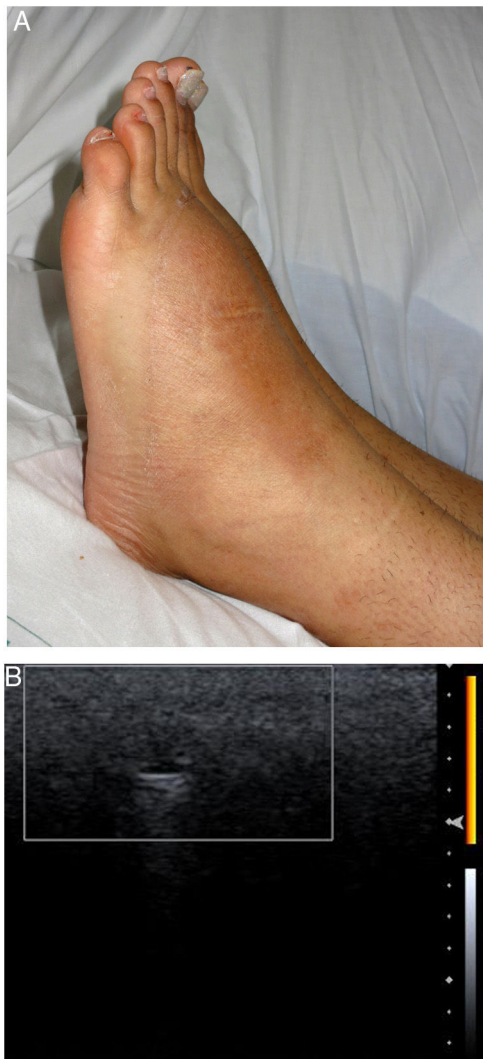
Figura 1 Caso 1. A) Notorio aumento de volumen en ambos dorsos de los pies. B) Patrón «en nevada», pequeño pseudoquiste anecoico con refuerzo posterior sin incremento de la vascularización (ecografía modo Doppler color con sonda de 18 MHz).

magnitud de la reacción inflamatoria, definir el tipo de material infiltrado, monitorizar respuesta terapéutica y guiar procedimientos 5-7 . En nuestra serie la EAF detectó la presencia de fillers en todos los casos, incluso en dos pacientes en los cuales la tomografía axial computada no los había demostrado.