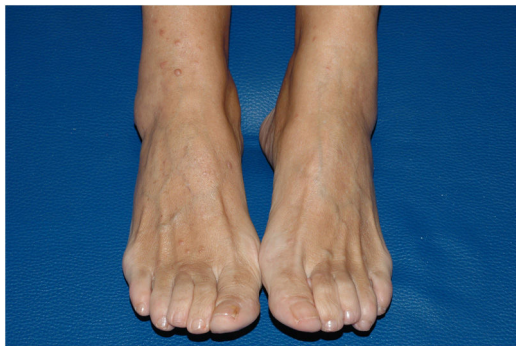
Figura 1 Pápulas y nódulos color piel normal en la cara anterior de piernas y pies compatibles con neurofibromas.

En 1982 se describió la primera clasificación de la NF en 8 subtipos, en la que el tipo 5 corresponde a la NF segmentaria, definida por la presencia de alteraciones de la pigmentación (que incluye manchas café con leche o pecosidades axilares) o de neurofibromas en un único segmento unilateral del cuerpo, sin cruzar la línea media, sin historia familiar de NF y sin afectación sistémica ni lesiones extracutáneas 2,7 . Posteriormente, dado que no todos los pacientes con afectación segmentaria se podían clasificar dentro de la descripción de NF tipo 5, Roth et al., en 1987, propusieron una clasificación de las NF segmentarias en 4 categorías: NF segmentaria verdadera, NF localizada con afectación profunda, NF segmentaria hereditaria y NF segmentaria bilateral 1,2,7 . También se ha realizado una cla-