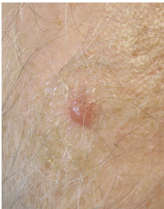
Figura 1 Nódulo anaranjado de base eritematosa en cuero cabelludo.

Varón de 66 años que acude por lesiones de aparición progresiva en la cabeza, el cuello y la parte superior de tronco, consistente en pápulo-nódulos anaranjados, de consistencia fibrosa y no infiltrados (fig. 1).