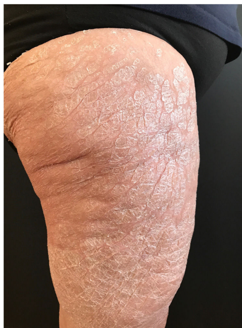
Figura 1 Placas descamativas especialmente llamativas en la zona anterior y lateral de ambos muslos.

se podía observar una hiperqueratosis compacta, ortoqueratósica y con una capa granulosa prácticamente ausente. A nivel de dermis papilar se observaba un infiltrado linfocítico muy leve sin otras manifestaciones significativas. Mediante tinciones de PAS y Grocott no se identificaron microorganismos. Se confirmó el diagnóstico de reacción ictiosiforme secundaria al uso de ponatinib, por lo que se decidió disminuir la dosis del fármaco a 30 mg y se inició tratamiento