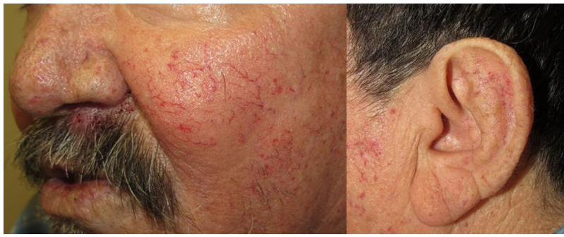
Figura 2 Múltiples telangiectasias arborizantes en mejilla y oreja.