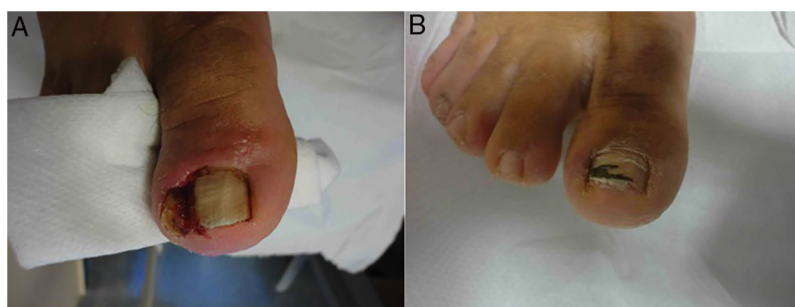
Figura 2 A. Paciente con onicocriptosis severa con hipertrofia del pliegue y granuloma reactivo. B. Resultado a los 3 meses tras 3 infiltraciones de triamcinolona.

recidiva de un problema dermatológico no exento de morbilidad.