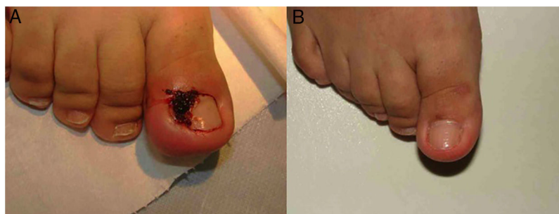
Figura 1 A. Paciente con onicocriptosis moderada-severa con importante eritema, edema y exudación. B. Resultado a las 3 semanas tras una única infiltración de corticoides.