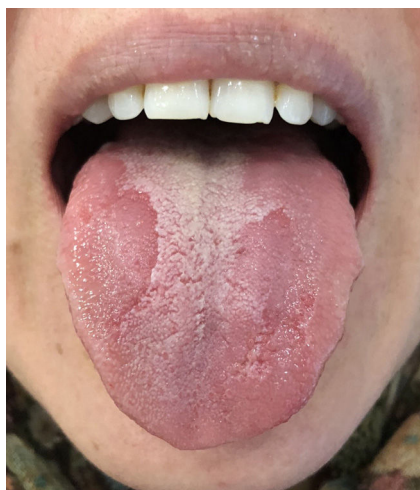
Figura 1 Placas eritematosas en ausencia de papilas filiformes.