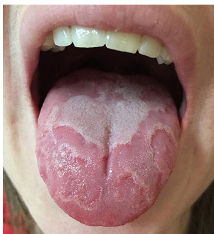
Figura 2 Placas eritematosas con un margen blanquecino bien definido localizadas en el dorso de la lengua.

alteraciones linguales, demostrando que hasta el 28% de estos pacientes presentaron una lengua fisurada y cerca del 4% tuvo una lengua geográfica 49 .