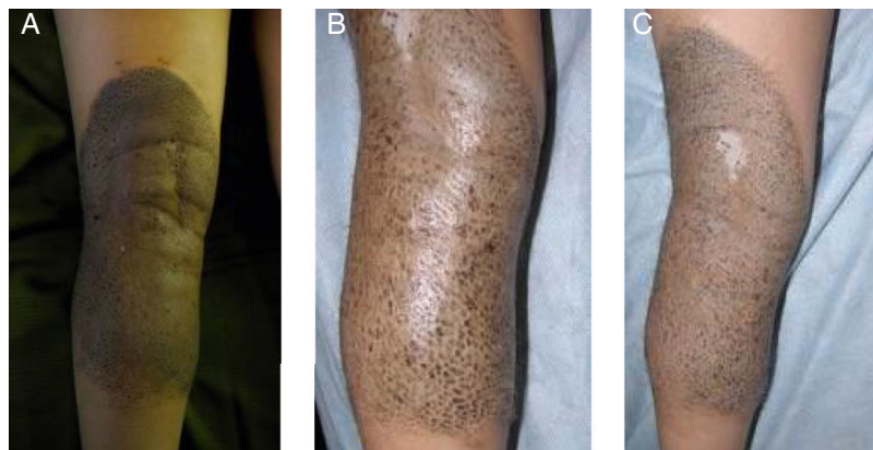
Figura 3 A) NMC mediano con pequeñas áreas de regresión. B) Seguimiento: obsérvense pérdida progresiva de pigmento a predominio folicular. C) Detalle: atrofia folicular. Obsérvense vellos sin pigmento.

El fenómeno de halo es un área de despigmentación que puede ocurrir alrededor de NMC y otras entidades 2 . Afecta al 1% de la población general, siendo su incidencia mayor en pacientes con vitíligo en edad pediátrica 2,8 . Existen múltiples teorías sobre su fisiopatogenia, mediando