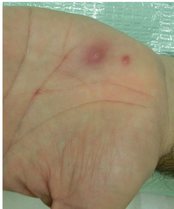
Figura 1 Dos pápulas eritematosas de 2 y 4 mm de diámetro respectivamente, la de mayor tamaño con hiperqueratosis central y halo eritematoso perilesional.

En adultos la ubicación más frecuente es a nivel genital y en zonas circundantes 2 . Independientemente de la edad, la afectación de palmas y plantas es excepcional. El primer caso de MC plantar fue publicado por Ingram et al. 3 en 1957, existiendo en la actualidad un total de 37 casos descritos, pero solo 13 bien documentados (tabla 1). La afectación