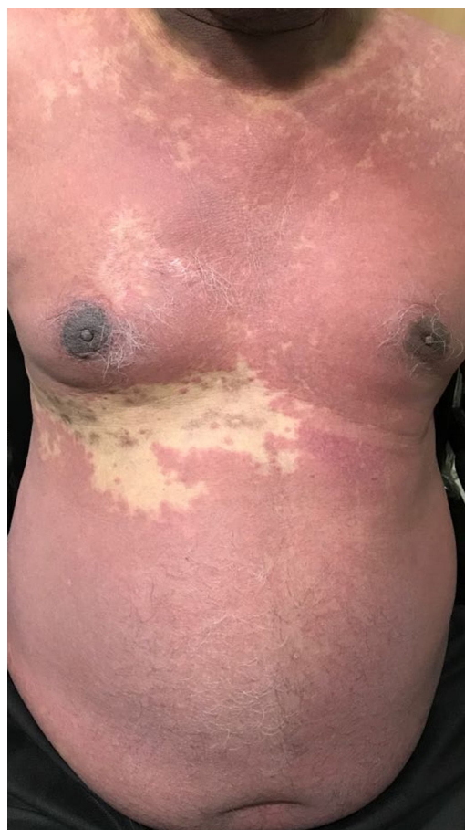
Figura 1 Lesiones máculopapulares eritematosas confluentes en el tórax y abdomen con preservación del dermatoma T9 derecho.

Las pruebas de laboratorio revelaron leucocitosis (LT: 15.500 mm 3 ; normal: 4.000-11.000 mm 3 ) con eosinofilia (RTE: 1.580 mm 3 ; normal: 40-440 mm 3 ). Los valores de las enzimas hepáticas (SGOT: 660 UI [normal: 7-40 UI]; SGPT: 590 UI [normal: 7-56 UI]), urea en sangre (120 mg/dl [normal: 10-40 mg/dl]) y creatinina sérica (1,9 mg/dl [normal: 0,3-1,2 mg/dl]) eran altos. La radiografía de tórax era normal y el intestino estaba distendido con acumulación de gases, sugestivo de íleo paralítico. El paciente presentaba hiperamilasemia (260 U/l [normal: 40-140 U/l]) sugestiva de pancreatitis. A continuación, desarrolló un síndrome de distrés respiratorio agudo letal. El diagnóstico de síndrome DRESS se estableció según los criterios de la escala de RegiSCAR 3 .