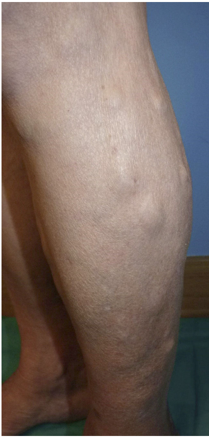
Figura 1 Múltiples nódulos subcutáneos, cubiertos por piel de color normal, en piernas.

VHH-8 en combinación con factores como la alteración del sistema inmune y un medio inflamatorio/angiogénico 1 . Se clasifica en 4 grupos clínico/epidemiológicos: SK clásico, SK endémico africano, SK asociado a VIH y SK por inmunosupresión terapéutica. En pacientes VIH suele ser con más frecuencia multicéntrico y con mayor afectación mucocutánea gastrointestinal, ganglionar, visceral y atípicas.