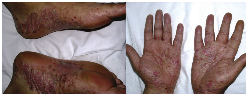
Figura 3 Psoriasis pustulosa de novo con afectación de las palmas y las plantas en un paciente con hidradenitis suppurativa a los 9 meses del inicio de tratamiento con infliximab.

con otro inmunosupresor, como metotrexato, parece tener influencia 19 .