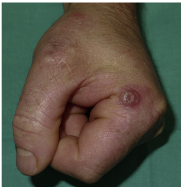
Figura 1 Nódulo solitario circunscrito por un halo eritematoso en la base lateral del segundo dedo de la mano izquierda.