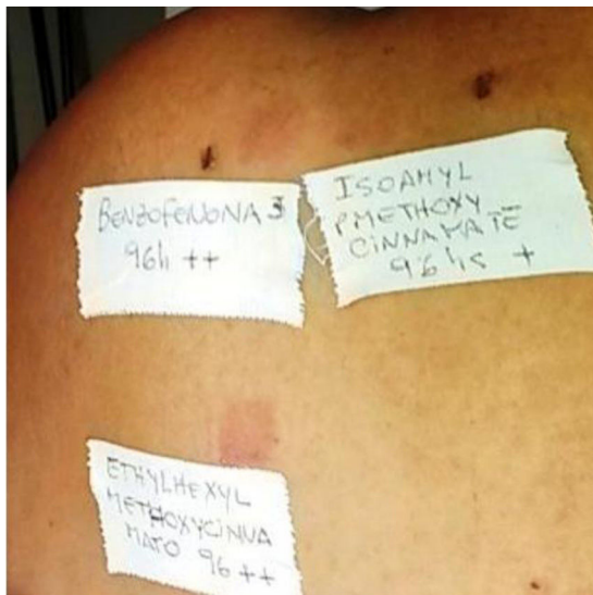
Figura 5 Reacciones en la zona irradiada a oxibenzona y a dos cinamatos confirmando DCFA a filtros solares orgánicos. Se reemplazan por pantallas físicas.

Tinosorb M® incluido en la batería de fotoalérgenos; este no suele comportarse como cromóforo sensibilizador, sino como hapteno de alergia por contacto. No observamos ningún caso de fotoalergia a ketoprofeno ni a octocrileno en nuestro estudio, pero sí 2 a dexketoprofeno sin relevancia conocida.