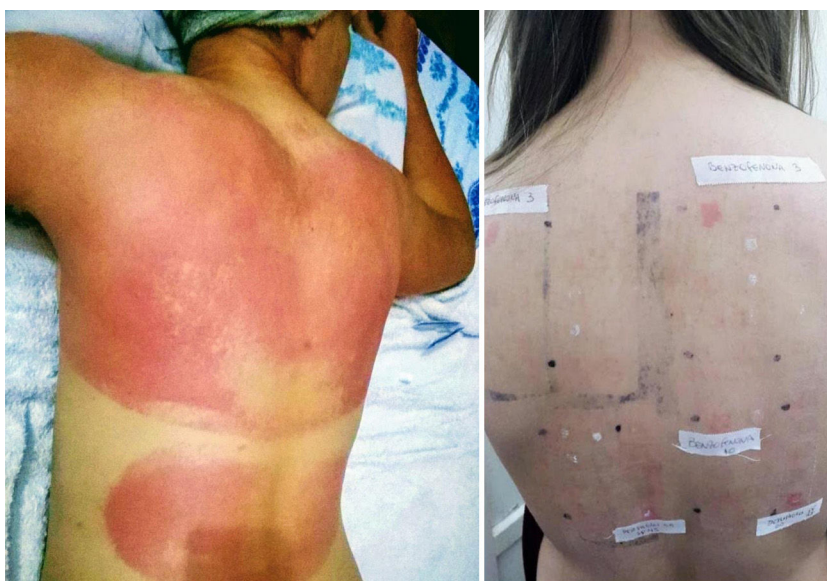
Figura 4 Paciente con reacción de fotosensibilidad tras exponerse al sol con protector solar pediátrico. Paciente con antecedente de intolerancia a cosméticos. Después de la prueba, la paciente presentó reacción de fotosensibilidad a la benzofenona-10 y reacción en zona irradiada y no irradiada a benzofenona-3, ambas sustancias compuestos del protector solar.

Además, se encuentran en productos industriales como pinturas, barnices, gomas y plásticos, para extender su durabilidad y reducir la fotodegradación 20 .