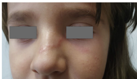
Figura 1 Trayecto eritematoso y serpiginoso de la larva cutánea migrans afectando a la región del dorso nasal y paranasal izquierdo.

tes de viajes en los últimos meses fuera de la comunidad, aunque sí refería que la niña había estado en contacto con la arena de una playa Cantabra durante unos días soleados. La exploración cutánea reveló en dorso nasal y extendiéndose a la región paranasal izquierda, la presencia de una lesión eritematosa, ligeramente sobreelevada y de trayecto serpiginoso (fig. 1). Considerando las características clínicas típicas de la lesión se estableció el diagnóstico de LM. Se instauró tratamiento con albendazol 400 mg/día