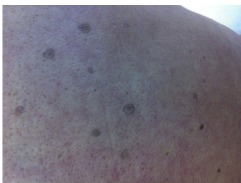
Figura 1 Máculas ovaladas de color marrón-grisáceo, levemente palpables, bien delimitadas, de entre 2 y 5 mm de diámetro, muchas de ellas con correlatos de escamas.