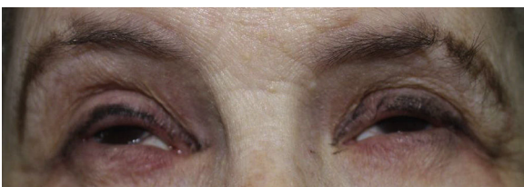
Figura 2 Anquilobléfaron congénito, intervenido en varias ocasiones, y fotofobia importante. Alopecia en parches que afecta a cejas y párpados.

El gen TP63 es un miembro de la familia genética TP53 que codifica la expresión de p63, una molécula clave en el desarrollo craneofacial y de las extremidades en la diferenciación de la piel y la carcinogénesis. Su estructura consiste en 5 dominios, incluido el de transactivación, el de unión al ADN, el de oligomerización, el dominio con motivo alfa estéril (SAM) y el de inhibidores de transactivación. Las mutaciones de TP63 que asocian