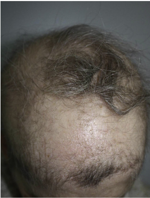
Figura 1 La paciente presentaba cabello tieso, pálido y escaso congénito en cuero cabelludo, cejas y párpados.

de AEC. Una biopsia del cuero cabelludo reveló la presencia de estructuras pilosas rudimentarias, algunas de las cuales dieron lugar a cabello de tipo veloso y ausencia total de glándulas sebáceas (fig. 3).