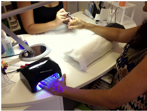
Figura 1 Esteticista realizando la técnica de esmalte permanente (EP) en una mesa de trabajo con dos lámparas, una a cada lado de la cliente. Obsérvese como el primer dedo de la mano introducida en la lámpara se encuentra fuera de ella. Para que el acrilato polimerice correctamente se debe exponer este dedo a la luz independientemente, en un segundo tiempo.

can aceites esenciales para finalizar con el procedimiento. Una esteticista entrenada es capaz de aplicar la técnica completa de EP en solo 15-30 min.