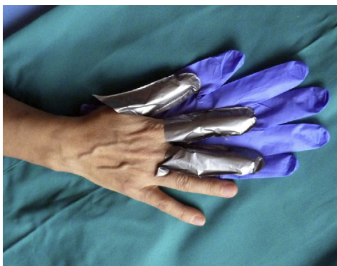
Figura 4 Correcta protección de la mano dominante con dediles de guantes 4H ® . Encima se deben poner guantes de nitrilo para mantener los dediles en el sitio y favorecer la destreza para este tipo de tarea.

dedos. En casi todas las esteticistas afectadas se observa un cierto grado de onicolisis, hiperqueratosis subungueal y hemorragias en astilla. No se han observado casos graves de parestesias 18 ni onicodistrofia 19 , como sucede en la DAC por uñas acrílicas.(fig. 4)