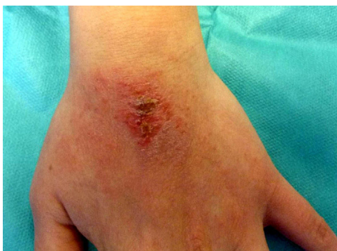
Figura 3 Eczema en dorso de mano no dominante en una paciente que reconocía limpiarse el dedo de la mano dominante con el que retiraba la rebaba del esmalte que quedaba por fuera de la uña.