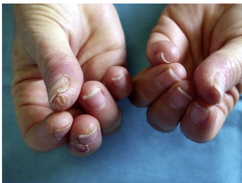
Figura 2 Lesiones clínicas características en las esteticistas: pulpitis seca fisurada de los primeros dedos de ambas manos con predominio de la mano dominante.