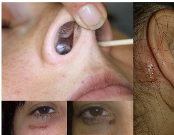
Figura 3 Perforación del septo nasal y lesiones escoriadas en ojo derecho y zona retroauricular derecha.

complementarias para cerciorar la ausencia de enfermedad orgánica. Anwar et al. 9 analizaron el impacto económico asociado a los pacientes con dermatitis artefacta en Irlanda y calcularon que el coste era, como mínimo, de 64.500 € por paciente.