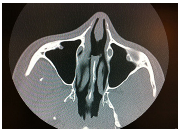
Figura 1 TAC: se observa perforación del septo nasal sin otras alteraciones.

La paciente fue valorada por el servicio de otorrinolaringología (ORL) sin hallar anomalías en los estudios realizados: analítica sanguínea incluyendo serología luética, ECA, ANA, anti-DNA, c-ANCA y p-ANCA; determinación de tóxicos de orina y cultivos bacterianos sin gérmenes patológicos. Mediante rinoscopia se observaba una perforación septal de bordes cruentos. La TAC permitió visualizar la perforación septal sin evidencia de enfermedad en los senos ni en las demás estructuras óseas (fig. 1). Se practicaron 6 biopsias en sacabocados evidenciando una mucosa ulcerada con fibrosis e inflamación del corion, en ausencia de fenómenos de vasculitis, trombosis, granulomas ni atipia (fig. 2). En servicios de ORL se pautó, durante 18 meses, tratamiento con antibióticos tópicos y orales con escasa mejoría, y posteriormente, le fue implantado un botón septal que fue retirado a los 15 días por intolerancia de la paciente.