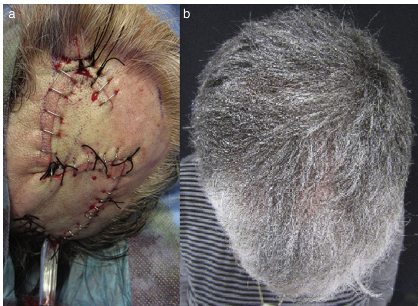
Figura 2 a) Resultado del colgajo en el postoperatorio inmediato, y b) Resultado final a los 2 meses de seguimiento.

únicas posibilidades reconstructivas recogen la realización de plastias a nivel local o colgajos libres vascularizados, ya que un injerto en esa situación no tendría lecho para nutrirse y prender, llevando a su pérdida.