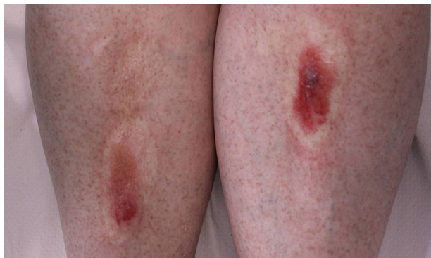
Figura 1 Placas bilaterales atróficas con ampollas superimpuestas.

Los traumatismos locales podrían representar otro factor etiopatogénico, dado el contenido hemorrágico de algunas de las