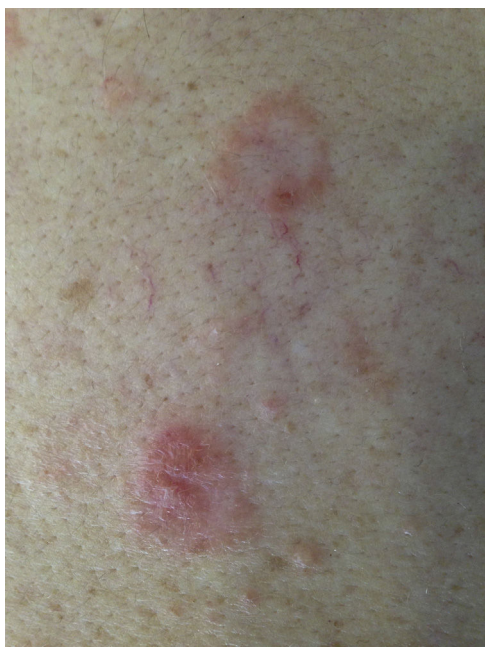
Figura 1 Imagen clínica. Lesiones pápulo-vesiculosas de base eritematosa y morfología anular afectando a la espalda.

Una mujer de 43 años sin antecedentes personales ni familiares de interés acudió a nuestra consulta de dermatología por un cuadro clínico de lesiones cutáneas muy pruriginosas, localizadas principalmente en la espalda. A la exploración física se observaron placas anulares de hasta 3 cm de diámetro formadas por pápulo-vesículas eritematosas de 1-2 mm con distribución herpetiforme localizadas en la espalda (fig. 1). No mostró afectación de mucosas, y el signo de Nikolsky fue negativo. En el estudio histológico de una de las lesiones se observó espongirosis neutrofílica. El estudio de inmunofluorescencia directa (IFD) mostró depósitos intercelulares de inmunoglobulina G (IgG), siendo negativa para C3 (fig. 2). Los exámenes complementarios solicitados incluyendo hemograma, bioquímica general con perfil hepático y renal, serología de hepatitis B, hepatitis C y virus de la inmunodeficiencia humana fueron normales o negativos. El estudio de autoinmunidad por Enzyme-Linked ImmunoSorbent Assay (ELISA)