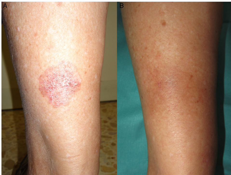
Figura 3 Mujer de 80 años con lesión de enfermedad de Bowen en la cara posterior de la pierna izquierda, de difícil abordaje quirúrgico (A). Tras 3 ciclos de TFD con MAL presenta respuesta completa de la lesión sin recidiva y sin secuelas tras el tratamiento (B).