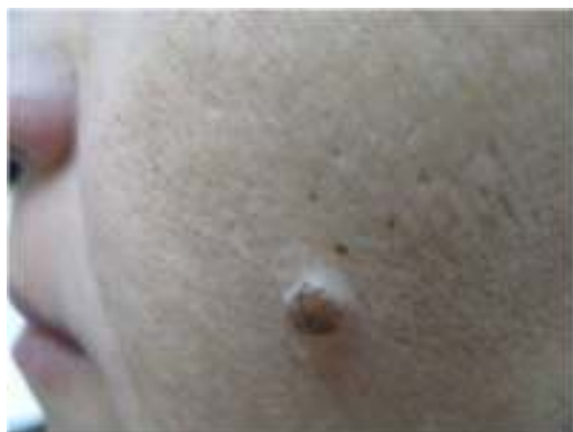
Figura 2 Nevo melanocítico en la cara de un adulto.

que los criterios de diagnóstico para melanoma en este caso son diferentes a los clásicos utilizados para la disquisición entre nevo y melanoma en otras topografías. Por ejemplo, en una biopsia proveniente de una lesión como la de la figura 1 la sola presencia de nidos en la unión dermo-epidérmica, y abundante elastosis solar, ya debe hacernos pensar en melanoma in situ ( fig. 3 ). No importa si los melanocitos son atípicos, o si ascienden en forma pagetoide o