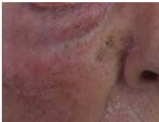
Figura 1 Lesión pigmentada plana en la cara de una persona mayor.