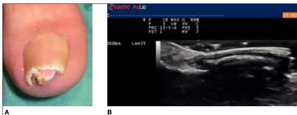
Figura 3 Exóstosis subungueal. Ecografía de la exóstosis subungueal. Corte longitudinal con sonda de 18 MHz.

Imagen nodular hipoeoica situada en el lecho ungueal con aumento de la vascularización 45 . Se detecta flujo sanguíneo arterial intratumoral, con velocidad sistólica máxima entre 3,7 y 21,1 cm/s. Es común ver remodelación del margen óseo de la falange distal por debajo del tumor, lo que refleja el crecimiento lento del tumor.