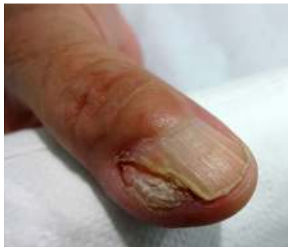
Figura 1 Queratoacantoma; fotografía clínica. Lesión nodular, color piel que compromete el borde ungueal y periungueal ulnar y proximal del dedo pulgar derecho.

Nuestro caso mostró un aspecto ecográfico no habitual, siendo hipocogénico y con un área de menor ecogenicidad