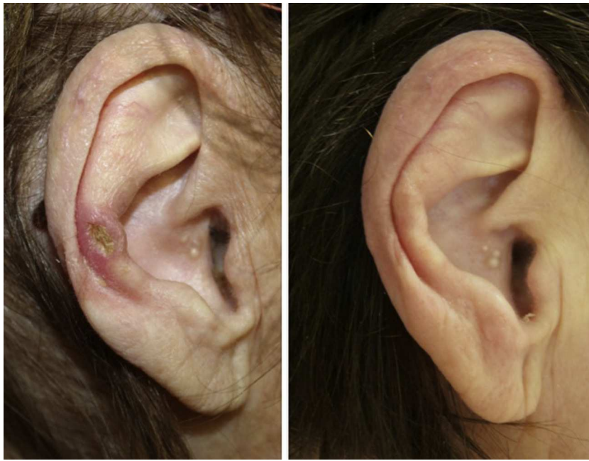
Figura 1 Imagen clínica del paciente 17 antes y tras el tratamiento.

los pacientes (48%) había realizado uno o varios tratamientos previos junto con medidas generales para reducir la presión sobre la lesión con falta de respuesta (fracaso primario) o recaída posterior (fracaso secundario). El resto de pacientes recibieron la fórmula como primer tratamiento. Los datos clínico-demográficos, así como los de eficacia se resumen en la tabla 1 .