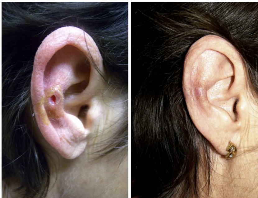
Figura 2 Imagen clínica del paciente 20 antes y tras el tratamiento.

El seguimiento postratamiento de los pacientes respondedores se realizó durante un periodo medio de 5,9 meses (rango temporal de 3 a 18 meses). El 48% de los pacientes