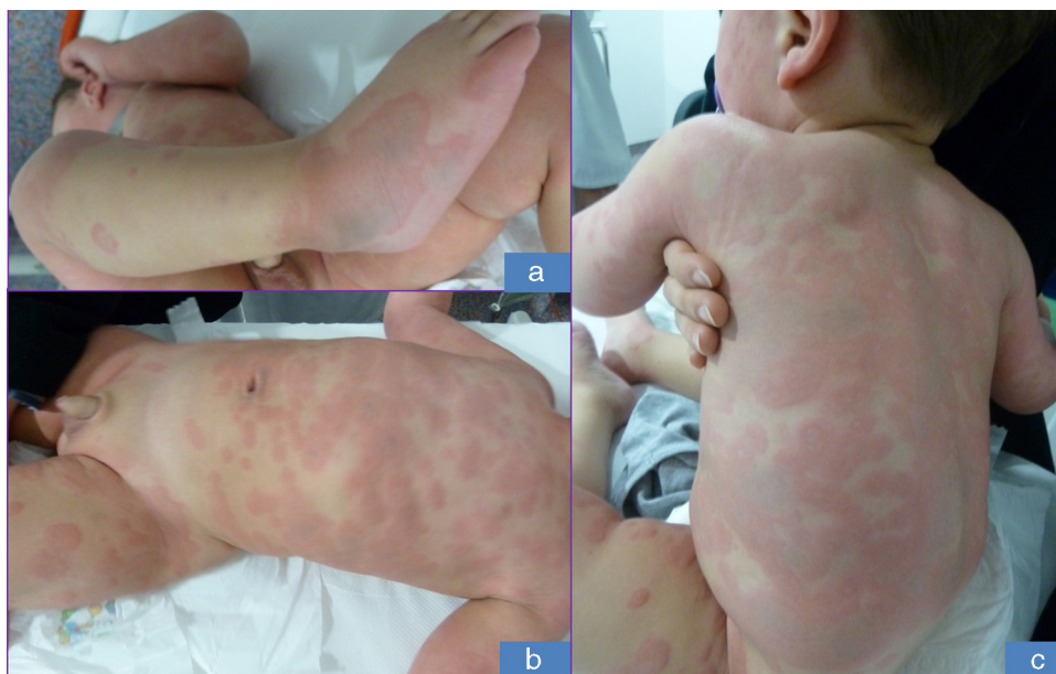
Figura 2 Lesiones urticariformes pequeñas que crecen centrífugamente dejando una zona equimótica central en pierna y pie (a), cara anterior del tronco (b) y en dorso confluyendo hasta ocupar casi toda la espalda (c).