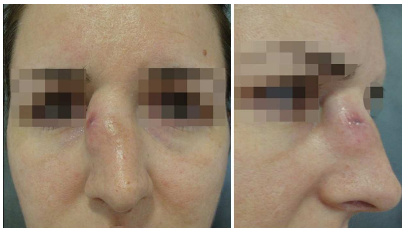
Figura 1 Nódulo sólido, de superficie lisa y contornos irregulares en la cara lateral derecha del dorso nasal.