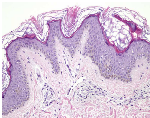
Figura 2 Hematoxilina-eosina × 20.