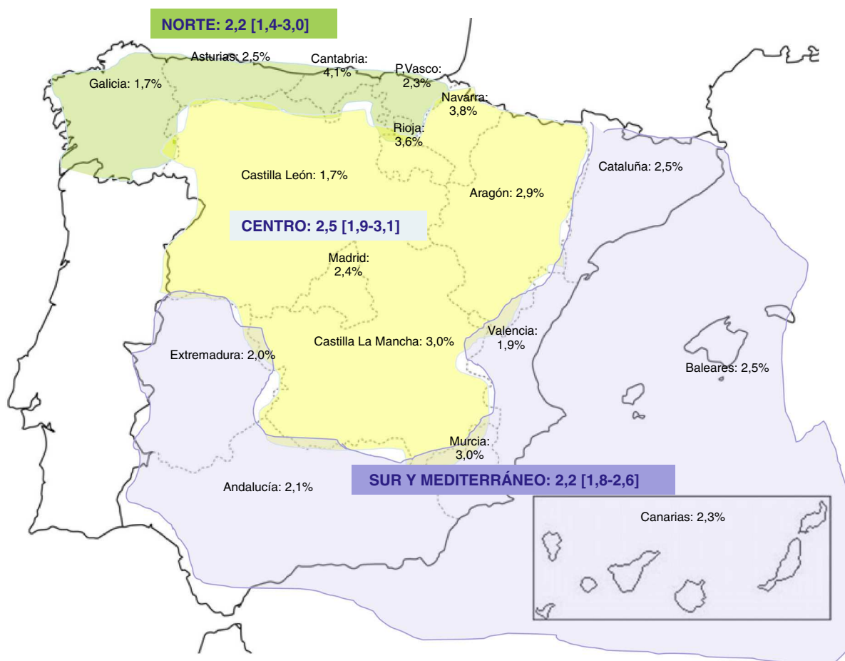
Figura 3 Prevalencia en las distintas comunidades autónomas y regiones geográficas agrupadas según las características climáticas.

y región norte de clima húmedo y frío (Asturias, Cantabria, Galicia y País Vasco), las cifras de prevalencia estimadas fueron de 2,2, 2,5 y 2,2% respectivamente sin diferencias significativas entre ellas.